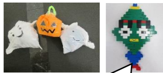
お友達がレゴブロックでつくりました！