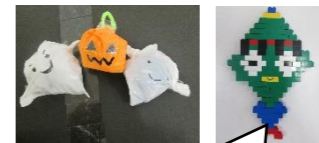
お友達がレゴブロックでつくりました！